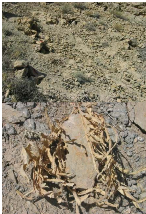
شکل ۲: مرحله علامت گذاری بوته‌ها، پیچاندن، کول کنی و مرحله تیغ زنی و برداشت آنگوزه به ترتیب