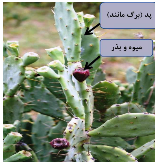
شکل ۱: تصویر شماتیک گیاه O. stricta

آن، می‌تواند گامی در جهت استفاده بهینه از مراتع خشک و شور باشد. شاخص‌های تعیین کیفیت علوفه شامل، ADF، الیاف خام، پروتئین خام و انرژی خام است (۱۵). ارزانی (۲۰۰۹) در تحقیقات خود بیان داشت که چهار شاخص پروتئین، DMD، ME و ADF مهم‌ترین صفات تعیین کننده کیفیت علوفه می‌باشد (شکل ۱).