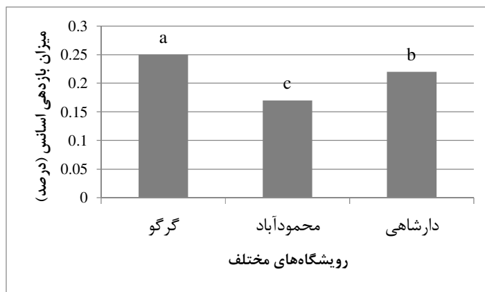
شکل ۲: مقایسه میزان بازدهی اسانس گیاه آوندول در سه رویشگاه مورد مطالعه (** حروف لاتین نشان‌دهنده نتایج مقایسه میانگین‌ها با Mean \pm SE ) (با آزمون دانکن است).

میزان بازدهی اسانس گیاه آوندول در جمعیت دارشاهی، ۲۲/۰ درصد می‌باشد (شکل ۲).