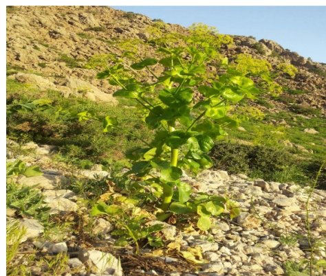
شکل ۱: گیاه دارویی Smyrniun cordifolium Boiss.

رویشگاه آن در طی زمان، عامل ایجاد تنوع ژنتیکی و متعاقبا تشکیل کموتایپ‌های متفاوت است. بنابراین با نظر به اهمیت اسانس استحصالی از گیاه دارویی S. cordifolium به واسطه حضور ترکیبات ارزشمندی نظیر کوروزرن، کوروزرنون و ژرماسرن دی (۴) و عنایت به اینکه مضاف بر طبیعت ژنتیکی گیاه، شاخصه‌های رویشگاهی نیز می‌توانند بر مولفه‌های کمی و کیفی اسانس حاصله از گیاهان آروماتیک اثری قابل تامل برجای گذارند (۱۳ و ۲۹)، لذا بررسی رفتارهای اکولوژیکی و شناسایی مناسب‌ترین مکان رویش گیاهان آروماتیک، گامی موثر در جهت ترویج شیوه‌های علمی کشت و تولید این گیاهان بوده و ضمن کاهش فشار بر عرصه‌های مرتعی و حفاظت ذخایر طبیعی، بهداشت و سلامت جامعه نیز به سبب عدم استفاده از اسانس‌های سنتتیک تضمین خواهد شد. با توجه به پراکنش فراوان گیاه آوندول در مناطق غرب و جنوب غربی کشور ایران و اهمیت ترکیبات ارزشمند آن، ضرورت معرفی شرایط بهینه اکولوژیک در کشت و توسعه این گیاه ضروری به نظر می‌رسد. پژوهش جاری نیز در همین راستا، با هدف بررسی تنوع فیتوشیمیایی گیاه S. cordifolium و معرفی کموتایپ‌های آن در سه رویشگاه گرگو، محمودآباد و دارشاهی در شهرستان بویراحمد انجام شد.