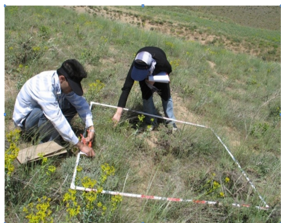
شکل ۲- پلات مورد استفاده در اندازه‌گیری پوشش گیاهی در حوزه زوجی گنبد

ویژگی‌های پوشش سطح خاک بر اساس اندازه‌گیری ۵۳ پلات در سطح زیرحوزه شاهد و نمونه به دست آمد. شاخص‌های آماری تمامی پارامترها نیز برای بررسی بهتر آنها محاسبه گردید که نتایج آنها در جدول (۱) برای زیرحوزه‌های مورد مطالعه آمده است.