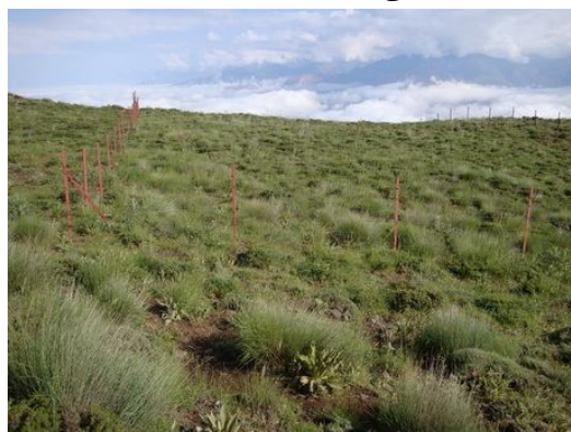
شکل ۱- نمایی از داخل سایت کوهستانی الموت قزوین

مراتع الموت در استان قزوین در فاصله ۱۰۰ کیلومتری شمال شرقی قزوین در محدوده بخش الموت شرقی قرار دارد. دارای اقلیم نیمه‌خشک و خاک نیمه‌عمیق تا کم عمق است. شیوه بهره‌برداری از مراتع روستایی می‌باشد. نوع دام توده‌های آمیخته گوسفند که ۷۰ درصد محلی (توده‌های بومی جثه دام‌های بالغ کوچکتر و چابک برای مناطق کوهستانی است)، ۲۰ درصد فشندی و ۱۰ درصد آن زندی و متفرقه می‌باشد. ترکیب گله به نسبت ۳۰ درصد بز و ۷۰ درصد گوسفند می‌باشد. دوره مرطوب ۷ ماه (آبان، آذر، دی، بهمن، اسفند، فروردین و اردیبهشت) و فصل خشک ۵ ماه می‌باشد. میزان بارندگی میانگین ۳۰ ساله در محل اجرای طرح ۵۸۴/۴ میلی‌متر برآورد شده است. تیپ گیاهی منطقه براساس اندازه‌گیری پلات‌ها در داخل سایت Astragalus و Agropyrum intermedium microcephalus می‌باشد.