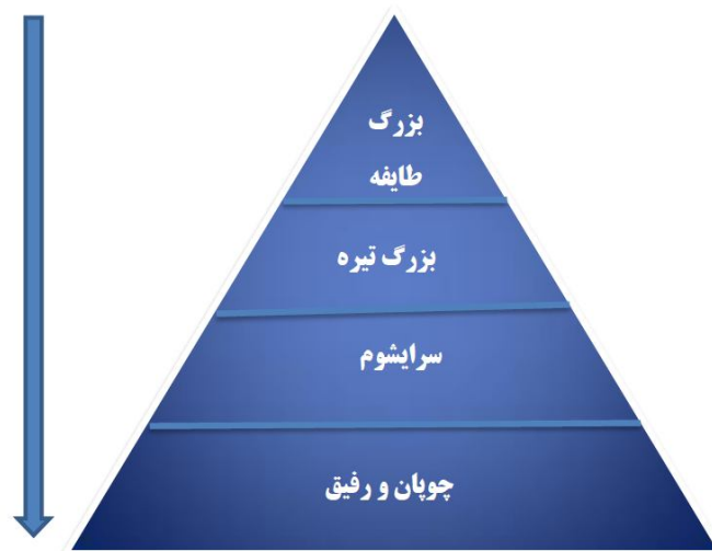
شکل ۱- نهاد اجتماعی عشایر محمدی سلیمانی