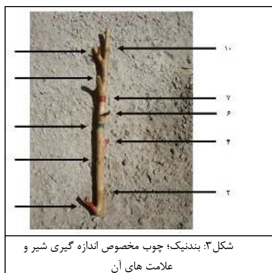
شکل ۳: بندنیک؛ چوب مخصوص اندازه‌گیری شیر و علامت‌های آن