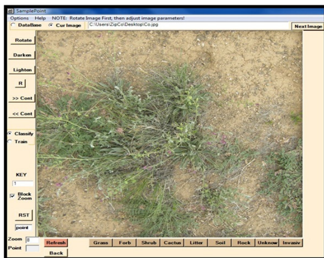
شکل ۲- فراخوانی و طبقه بندی تصاویر در نرم افزار Sample Point