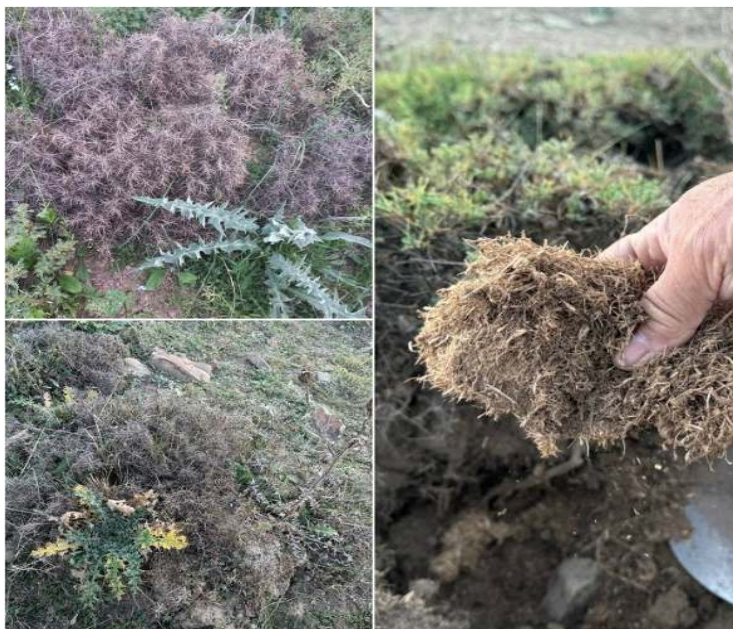
شکل ۵. حضور گیاه مهاجم خارپنبه ( Onopordum illyricum ) در بخش‌های مختلف گیاه گون و نمایی از خشک شدن ریشه گیاه (واقع در دامنه شمالی)