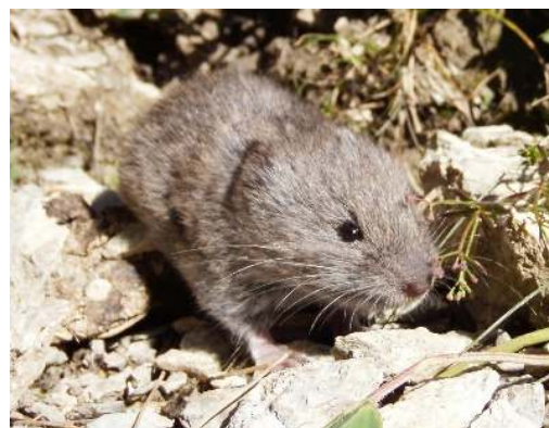
شکل ۳: ول برفی یا ول کوهی ( Chionomys nivalis )

ثبت فعالیت موش‌ها در پای بوته‌های گون نشان داد، حضور فیزیکی موش‌ها در پای بوته‌های تخریب‌یافته و یا در حال خشک شدن بیشتر می‌باشد و نوع موش منطقه با توجه به شناسایی تیم زیست‌شناسی جانوری "ول کوهی" یا "ول برفی" تشخیص داده شد. این گونه جانوری با نام انگلیسی European Snow Vole و نام علمی Chionomys nivalis شناخته می‌شود (شکل ۳).