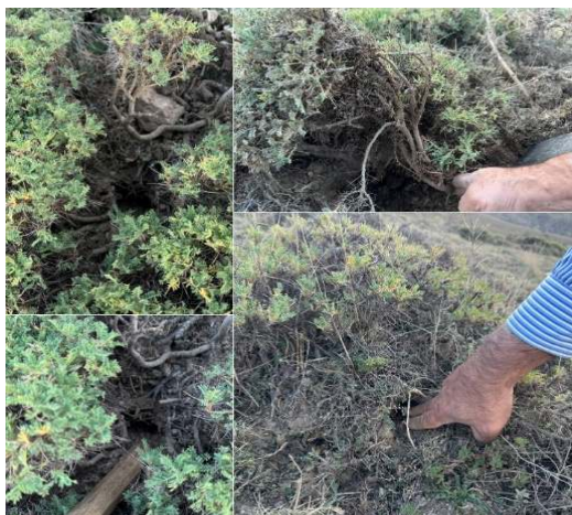
شکل ۴: حفره‌های ایجاد شده توسط جوندگان

ریشه‌ها، ساقه‌ها و برگ‌های گیاهان کوهستانی تغذیه می‌کند. در بهار و تابستان تولیدمثل می‌کند و در مناطق مرتفع کوهستانی، ارس‌زارها، مناطق بالای خط جنگل و چمن‌زارهای مناطق کوهستانی زیستگاه دارد (۱۷). به‌نظر می‌رسد در فصل سرد که مواد غذایی کم می‌شود، این موش‌ها از بخش‌های زیرزمینی گیاهان مانند ریشه‌ها استفاده می‌کنند. این گونه جانوری در طول روز فعال است ولی شب‌ها نیز گاهی دیده می‌شود. معمولاً در حال آفتاب گرفتن روی صخره‌ها دیده می‌شود. لانه‌اش را در میان شکاف سنگ‌ها و زیر ریشه گیاهان حفر می‌کند (شکل ۴).