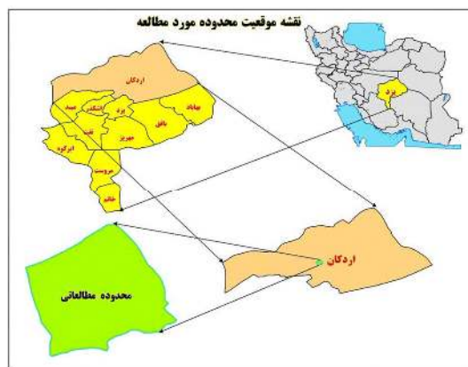
شکل: نقشه محدوده رویشگاه آنغوزه در گزستان