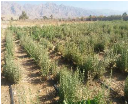
شکل ۵: نمونه زراعی آویشن شیرازی در شهرستان داراب