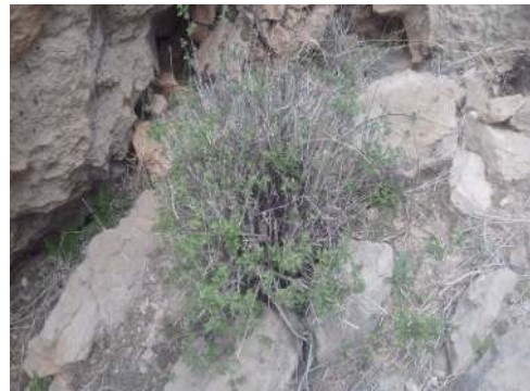
شکل ۲: نمونه آویشن شیرازی در رویشگاه طبیعی در شهرستان داراب