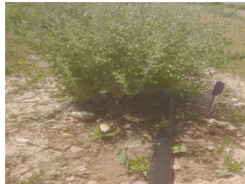
شکل ۴: نمونه زراعی آویشن شیرازی در شهرستان داراب