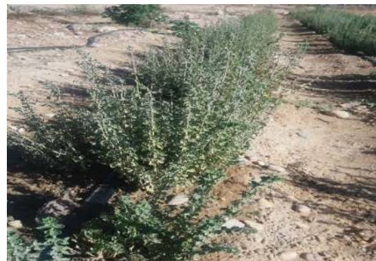
شکل ۶: نمونه زراعی آویشن شیرازی در شهرستان داراب (منبع: نویسنده، ۱۴۰۱)