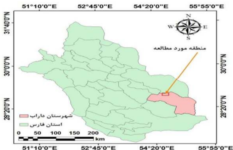
شکل ۱: موقعیت رویشگاه طبیعی آویشن شیرازی در شهرستان داراب