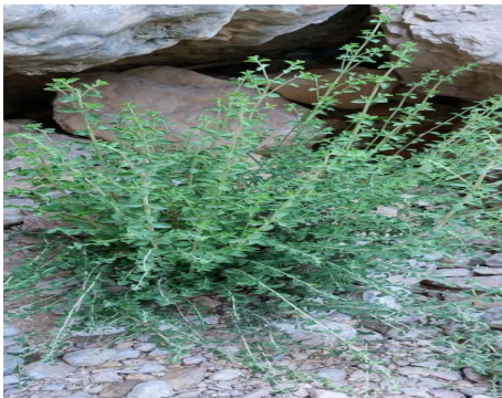
شکل ۳: نمونه آویشن شیرازی در رویشگاه طبیعی در شهرستان داراب